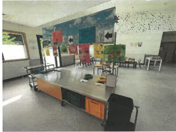
La table de tri avec les affiches